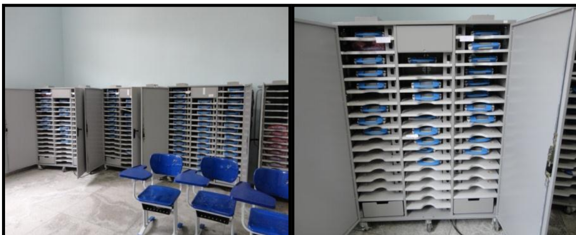
Figura 17 – Sala com armários de armazenamento dos laptops na escola Rui Barbosa.