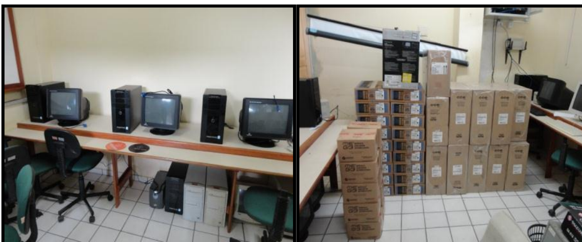
Figura 11 - Laboratório de informática da escola Rui Barbosa.