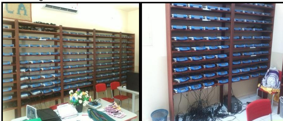
Figura 19 - Sala com armários de armazenamento dos laptops na escola Irmã Leodgard.