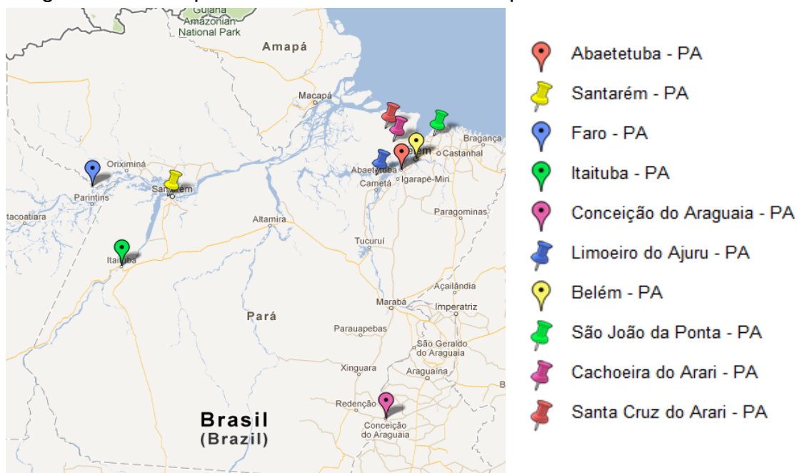
Figura 3 - Municípios do estado do Pará contemplados com o PROUCA.

A implantação do PROUCA no estado do Pará inicia em 2007, com o processo de seleção das escolas, mas somente em 2010 os laptops são entregues. As escolas, sendo 17 municipais e 6 estaduais, são distribuídas em 10 municípios, conforme a figura 3.