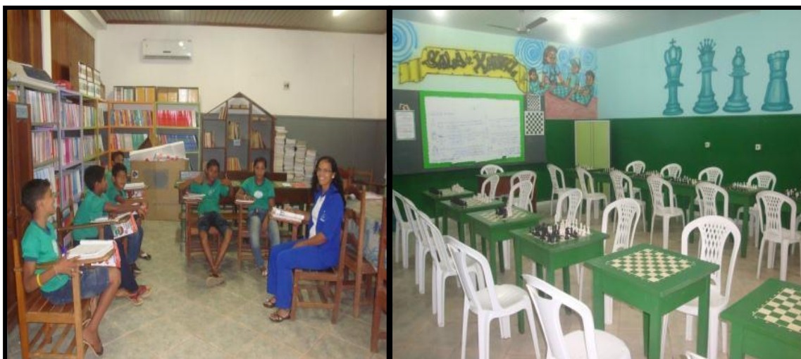
Figura 14 - Sala de Leitura e Sala de Xadrez da escola Santa Luzia.