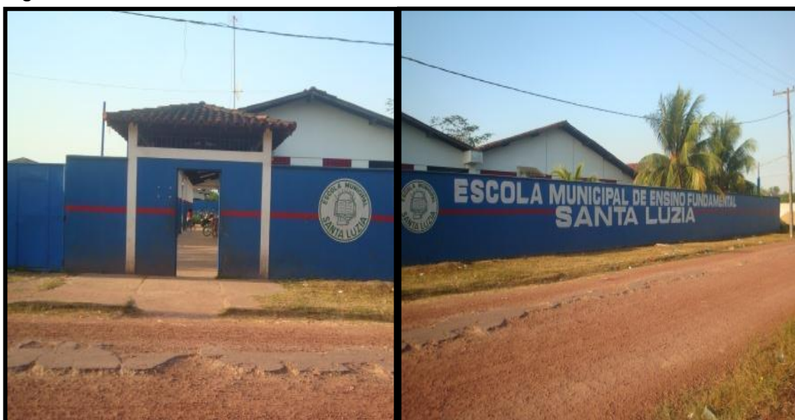
Figura 4- Frente da escola Santa Luzia.

rodoviário, da cidade de Belém. Os meios de transportes mais utilizados para chegar a essa cidade são rodovias ou hidrovias. São aproximadamente três horas de deslocamento da capital paraense para esse município. A escola Santa Luzia, conforme figura 4, fica localizada na Travessa Santa Luzia, 513, bairro Algodoal. Essa escola atende até a 4ª série (5º ano) do ensino fundamental e tem, principalmente, alunos que moram nas ilhas próximas ao município. Alunos que possuem baixa renda e que não têm acesso à tecnologia.