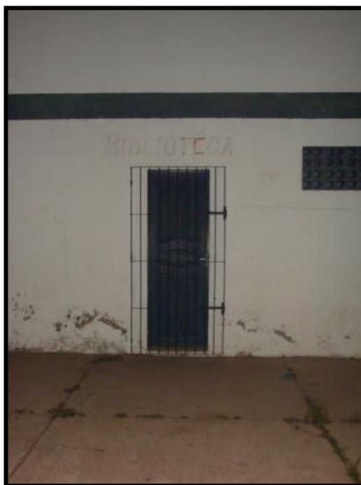
Figura 9- Biblioteca Fechada na escola Jerônimo Milhomem.

No quadro 5, os itens Rede Elétrica (RE) e Biblioteca (B), são marcados como “Parcialmente”. Isto se deve à presença precária destes nas escolas. Ainda, enfatiza-se que nas escolas que possuem biblioteca, foi relatado o raro acesso pelos alunos. Isso acontece por dois motivos: os alunos não são incentivados a utilizá-la e está fechada nos horários de funcionamento da escola, por falta de pessoa lotada para essa tarefa, como é o caso da escola Jerônimo Milhomem (ver figura 9).