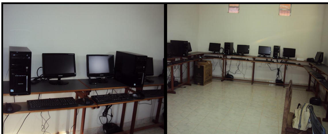
Figura 13 - Laboratório de Informática da escola Irmã Leodgard.