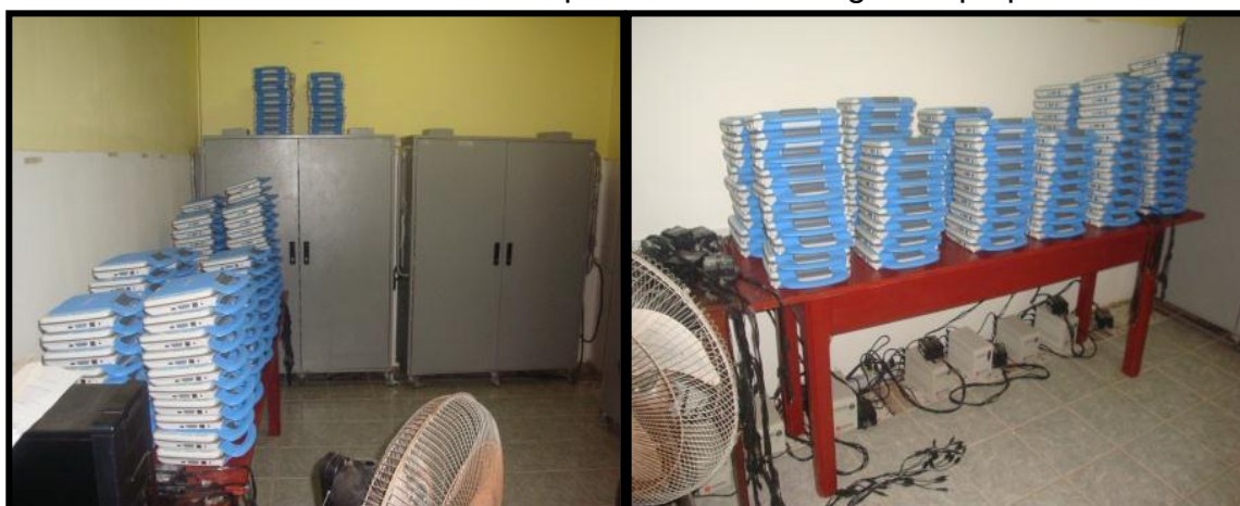
Figura 18 - Sala com armários de armazenamento dos laptops na escola Jerônimo Milhomem e mesa usada para armazenar alguns laptops.