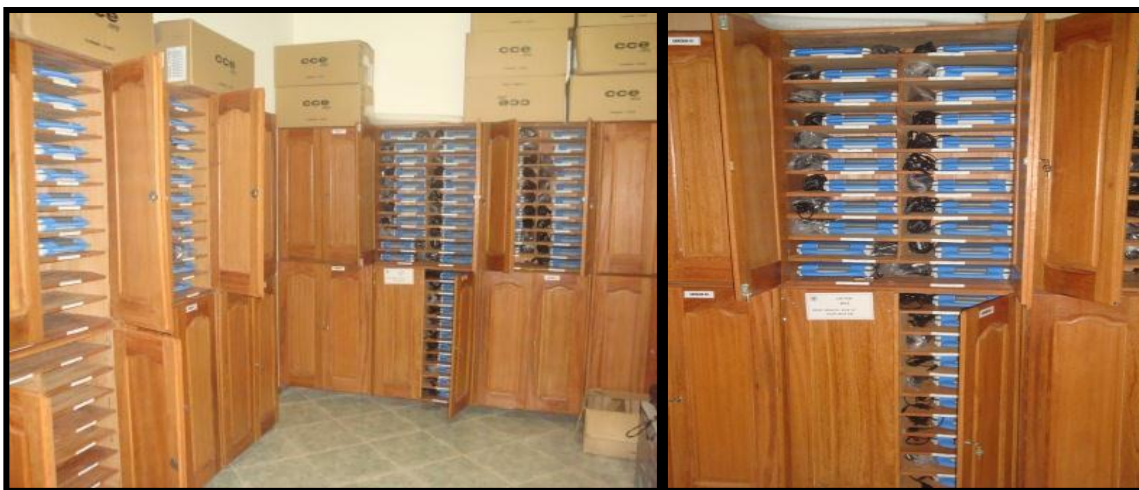
Figura 16 – Sala com os armários de armazenamento dos laptops na escola Santa Luzia.

Com exceção da escola Raimundo Pereira, que não tem uma sala específica para guardar os laptops, as demais escolas possuem sala e armários próprios para armazená-los, conforme ilustram as figuras 16, 17, 18 e 19. Ainda, na escola Jerônimo Milhomem, foi informada a falta de mais armários para guardar os equipamentos, sendo que estes são dispostos numa mesa improvisada, conforme figura 18.