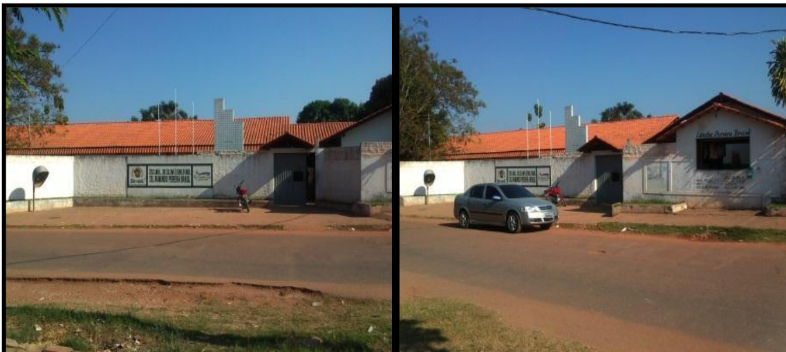
Figura 6 - Frente da escola Raimundo Pereira.