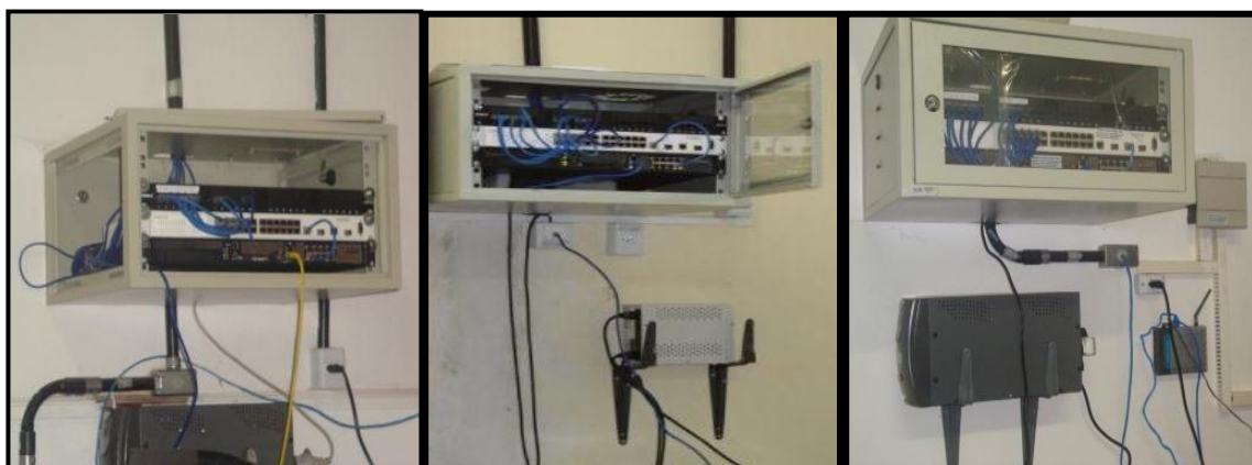
Figura 20 - Equipamentos de acesso da internet nas escolas Santa Luzia, Rui Barbosa e Jerônimo Milhomem.

Conforme o quadro 7, as seis escolas possuem parcialmente acesso à internet. Esse foi um dos maiores problemas relatados, já que sem internet não era possível alguns professores adiantarem as atividades propostas no plano de aula. No entanto, nas seis escolas existe internet disponibilizada pela empresa “Oi” (ver figura 20) que é somente para o uso dos laptops, mas de acordo com profissionais das escolas Raimundo Pereira e Jerônimo Milhomem, a velocidade 14 , não é adequada. Ainda, quando o acesso da Oi não funciona, as escolas Santa Luzia, Rui Barbosa, Raimundo Pereira e Irmã Leodgard utilizam a internet do programa Navegapará, instalada nessas escolas.