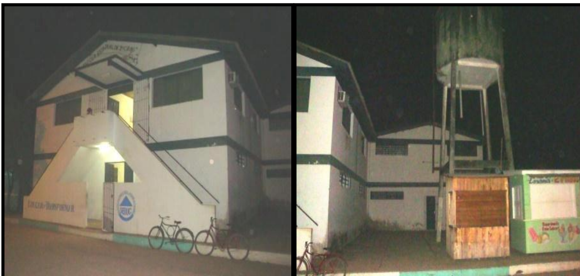
Figura 7 - Frente da escola Jerônimo Milhomem.

Limoeiro do Ajuru localiza-se a uma distância aproximada de 700 km, por meio rodoviário (SETRAN, 2006). Os meios de transportes mais utilizados para chegar a essa cidade são rodovias e hidrovias. São aproximadamente 7 horas de deslocamento, unindo rodovia e hidrovia. A escola Jerônimo Milhomem, conforme figura 7, localiza-se na Rua Nilo Fayal, S/N, bairro Cuba.