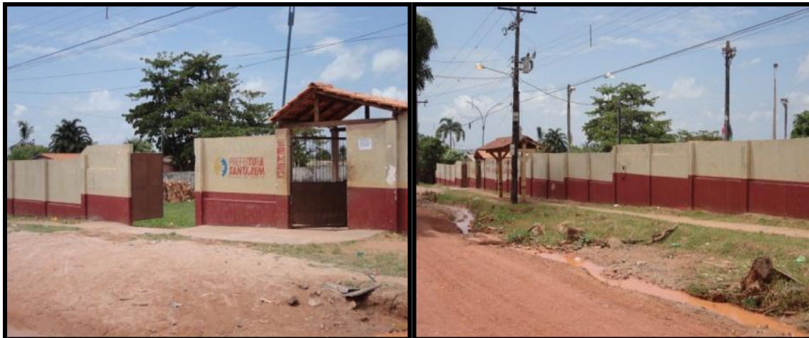
Figura 8 - Frente da escola Irmã Leodgard.

aproximadamente 2 horas de distância por meio aeroviário. A escola Irmã Leodgard, conforme figura 8, fica localizada na Rua Uruará, S/N, bairro Uruará.