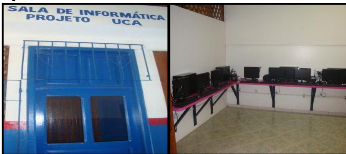
Figura 10 – Laboratório de Informática da escola Santa Luzia.

No que se refere aos laboratórios de informática, as escolas Santa Luzia, Rui Barbosa, Flora Teixeira, Raimundo Pereira, Jerônimo Milhomem e Irmã Leodgard informaram que existem, respectivamente, 18, 18, 21, 16, 12 e 15 computadores. No entanto, nas escolas Rui Barbosa e Irmã Leodgard os alunos ainda não utilizavam os equipamentos devido ao laboratório não estar montado completamente: na escola Rui Barbosa faltava organizar o laboratório para instalar as máquinas e na escola Irmã Leodgard faltava acesso à internet. Alguns laboratórios são apresentados nas figuras 10, 11, 12 e 13.