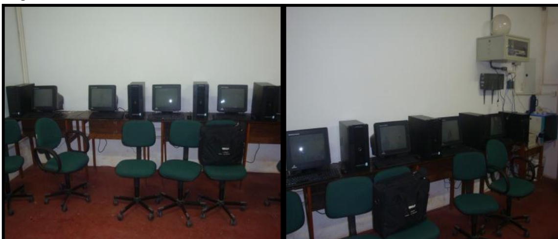
Figura 12 - Laboratório de Informática da escola Jerônimo Milhomem.