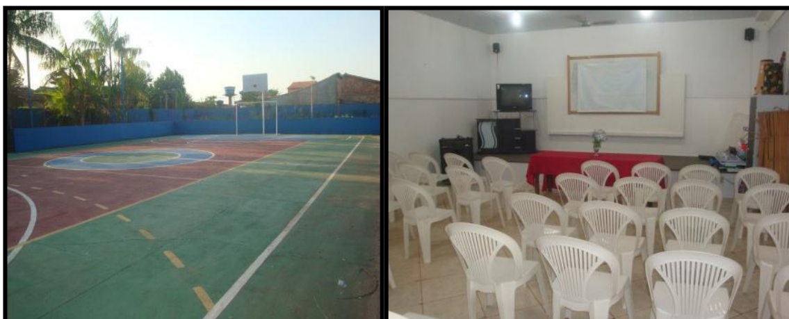
Figura 15 - Quadra de esportes e Sala de Vídeo da escola Santa Luzia.