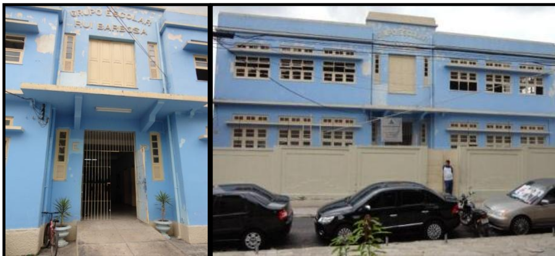
Figura 5 - Frente da escola Rui Barbosa.